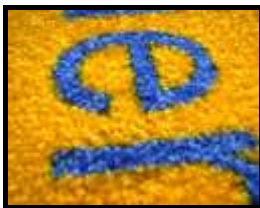
Ausschnitt 7x5 cm