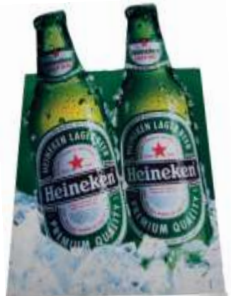
Größe: 30x20 cm

Der PVC-freie Gummirücken ist resistent gegen Mineral- und Pflanzenöle und viele Säuren. Gummi bleibt elastisch, auch im Winter.