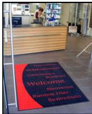
Größe: 85x115 cm