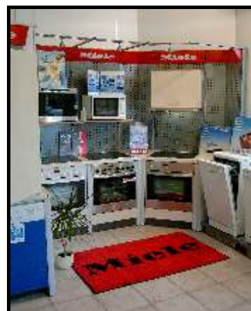
Größe: 60x85 cm

Der PVC-freie Gummirücken ist resistent gegen Petroleum, Mineral- und Pflanzenöle und viele Säuren. Gummi bleibt elastisch, auch im Winter.