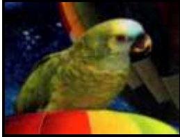
Ausschnitt 7x5 cm