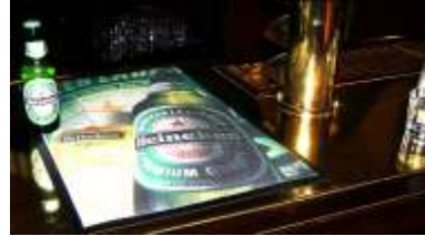
Größe: 45x65 cm