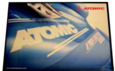
Größe: 90x120 cm